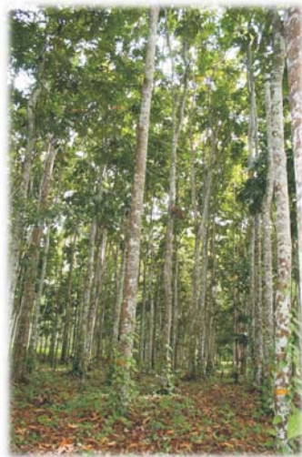
Gambar 4. Tegakan Pometia pinnata di Wanariset Anggresi Figure 4. Pometia pinnata stands in Anggresi

Setelah data diameter dari tanaman diperoleh, maka selanjutnya dilakukan penghitungan biomassa Pometia pinnata dengan menggunakan rumus Ketterings. Setelah biomassa tanaman didapatkan, selanjutnya kandungan C dalam Pometia pinnata diperoleh dengan mengalikan biomassa Pometia pinnata tersebut dengan nilai tetapan 0,46 (Hairiah, 2007)