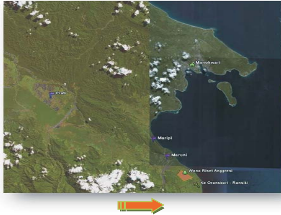
Gambar 1. Peta lokasi pengambilan sampel Figure 1. Map of sample location

Wanariset Aggresi sejak awal dibuat bertujuan sebagai kebun koleksi, sehingga perlakuan silvikultur seminimal mungkin dilakukan pada tanaman yang ada. Kegiatan yang secara periodik dilakukan adalah kegiatan penataan, pemeliharaan dan pengukuran.