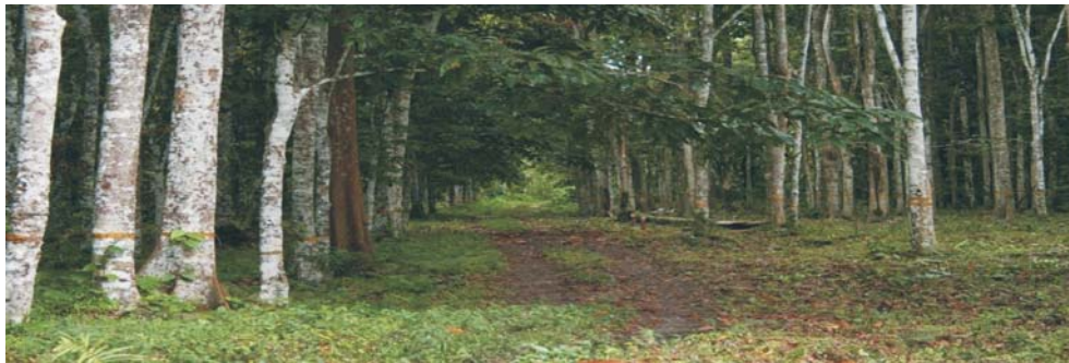
Gambar (Figure) 2. Wanariset Anggresi

Wanariset Aggresi sejak awal dibuat bertujuan sebagai kebun koleksi, sehingga perlakuan silvikultur seminimal mungkin dilakukan pada tanaman yang ada. Kegiatan yang secara periodik dilakukan adalah kegiatan penataan, pemeliharaan dan pengukuran.